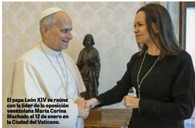
El papa León XIV se reúne con la líder de la oposición venezolana María Corina Machado el 12 de enero en la Ciudad del Vaticano.

Como explica Estados Unidos bajo ataque , esta historia es también una profecía. El Sr. Flurry escribe que la “amarga aflicción” son las políticas auto-