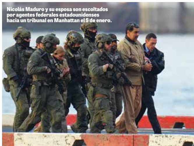
Nicolás Maduro y su esposa son escoltados por agentes federales estadounidenses hacia un tribunal en Manhattan el 5 de enero.

¿Pero garantizará buenos resultados este movimiento audaz y exitoso? La incursión en Caracas fue un ejemplo impresionante de cómo EE UU demuestra su poder para el bien. Pero aún quedan muchas preguntas.