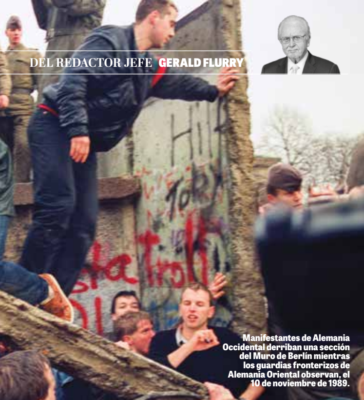
Manifestantes de Alemania Occidental derriban una sección del Muro de Berlín mientras los guardias fronterizos de Alemania Oriental observan, el 10 de noviembre de 1989.