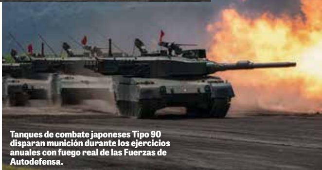
Tanques de combate japoneses Tipo 90 disparan munición durante los ejercicios anuales con fuego real de las Fuerzas de Autodefensa.

Esto desencadenó lo que el New York Times denominó “la transformación más significativa del ejército japonés desde la Segunda Guerra Mundial” (22 de julio de 2007). Entre otras cosas, Japón adquirió sistemas de defensa antimisiles, practicó el lanzamiento de bombas reales de 500 libras y envió tropas marítimas al océano Índico para ayudar en las operaciones estadounidenses.