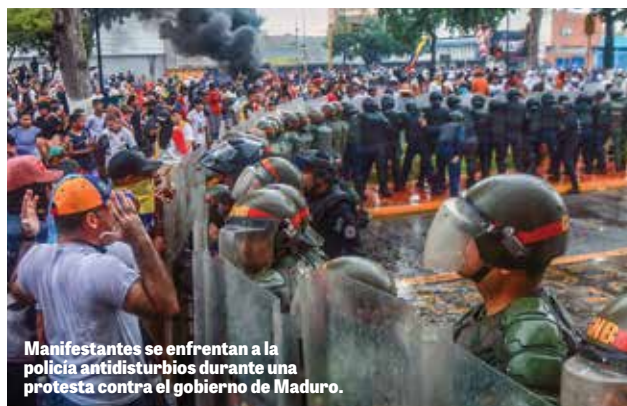
Manifesteros se enfrentan a la policía antidisturbios durante una protesta contra el gobierno de Maduro.

perpetran robos, extorsiones, atracos, prostitución, secuestros y asesinatos. Un grupo de derechos humanos estima que el comercio de drogas ilegales de los carteles en Venezuela generó más de 8.200 millones de dólares en 2024, la mayoría en cocaína y con destino a EE