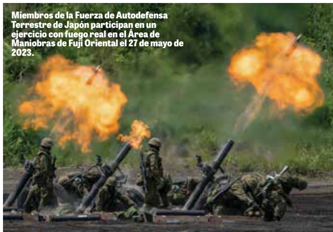
Miembros de la Fuerza de Autodefensa Terrestre de Japón participan en un ejercicio con fuego real en el Área de Maniobras de Fuji Oriental el 27 de mayo de 2023.

Luego vinieron los atentados terroristas del 11 de septiembre de 2001 contra el principal aliado de Japón.