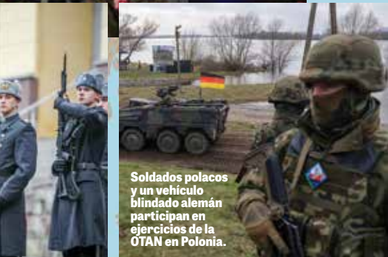
Soldados polacos y un vehículo blindado alemán participan en ejercicios de la OTAN en Polonia.