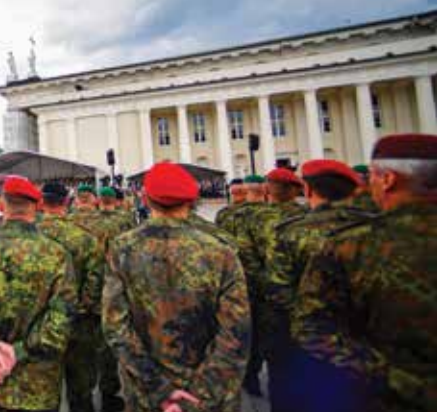
Helicópteros de ataque alemanes sobrevuelan una ceremonia de pase de revista el 22 de mayo en Vilna, Lituania.