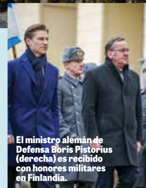
El ministro alemán de Defensa Boris Pistorius (derecha) es recibido con honores militares en Finlandia.

plenamente operativa en 2027. Según la página web de la Bundeswehr, estará formada por tres grandes unidades de combate: el 122º Batallón de Infantería Mecanizada y el 203º Batallón de Tanques (ambos de Alemania), y el Grupo de Combate Multinacional de Presencia Avanzada Reforzada de Lituania.