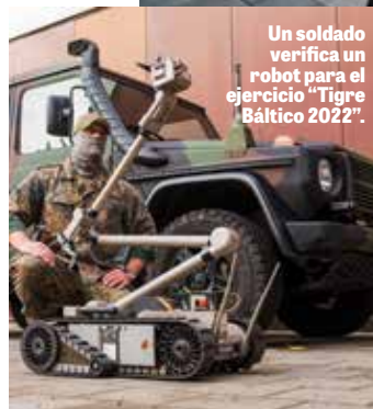
Un soldado verifica un robot para el ejercicio “Tigre Báltico 2022”.