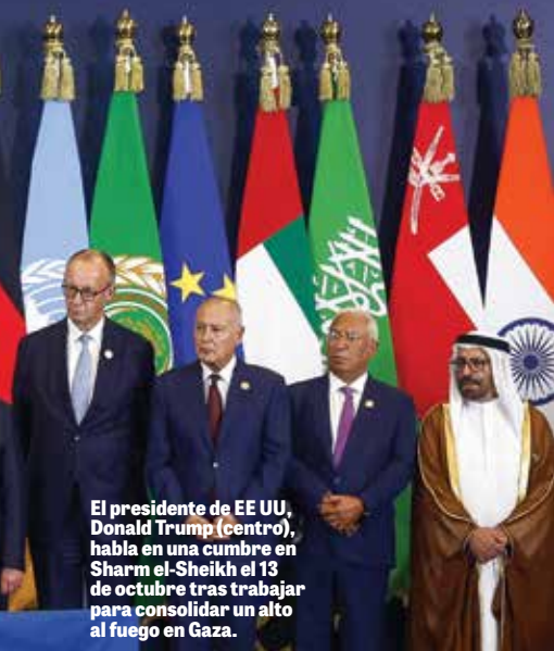
El presidente de EE.UU., Donald Trump (centro), habla en una cumbre en Sharm el-Sheikh el 13 de octubre tras trabajar para consolidar un alto al fuego en Gaza.

El preámbulo del pacto para la fundación de Hamás dice: “Israel existirá y seguirá existiendo hasta que el islam lo extermine, igual que exterminó a otros antes que él”. Hamás hizo esta declaración en su fundación en 1987 y sus miembros mantienen este credo hasta el día de hoy. Su emblema es una representación del característico tono verde de Hamás pintado sobre toda la Tierra Santa: “desde el río hasta el mar”.