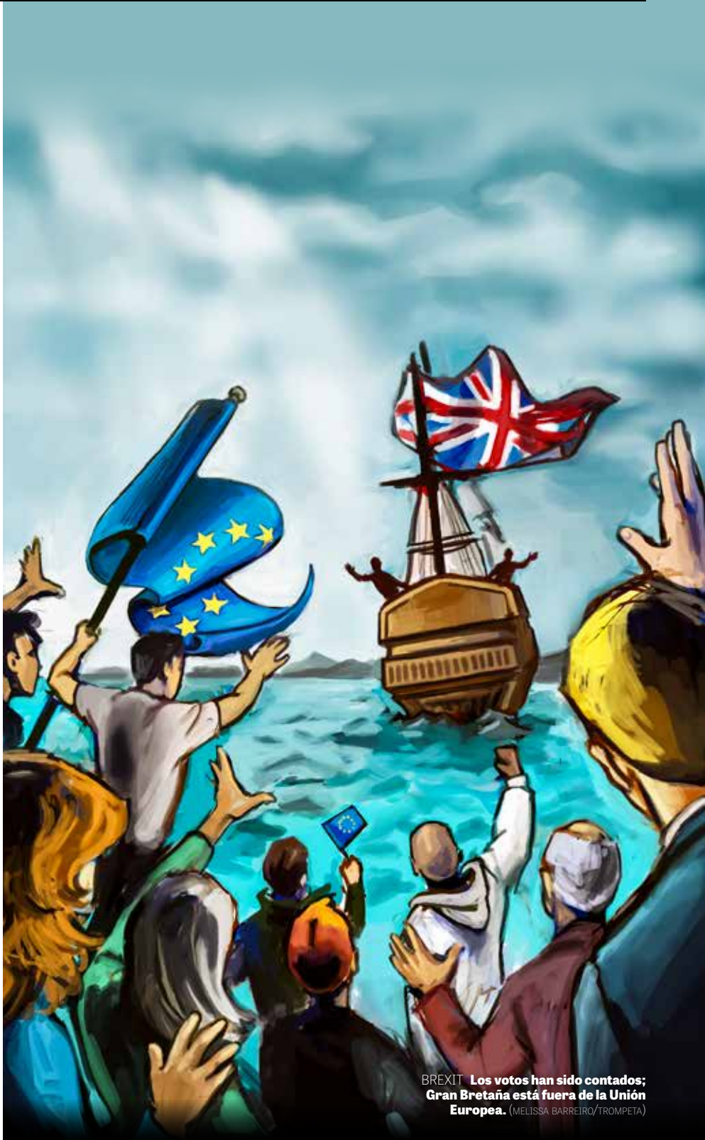
BREXIT Los votos han sido contados; Gran Bretaña está fuera de la Unión Europea.