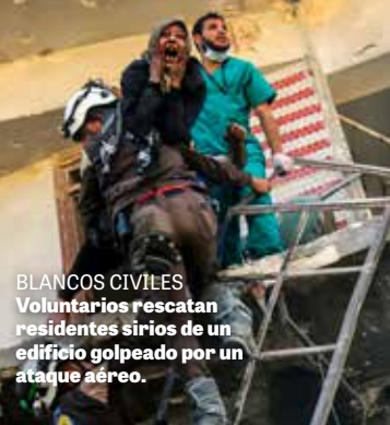
BLANCOS CIVILES Voluntarios rescatan residentes sirios de un edificio golpeado por un ataque aéreo.