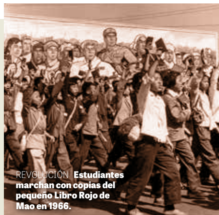
REVOLUCIÓN Estudiantes marchan con copias del pequeño Libro Rojo de Mao en 1966.

Esta campaña de propaganda patrocinada por el gobierno se basa fuertemente en imágenes de la era de Mao, despertando preocupación por un emergente culto de la personalidad y ¡una próxima era de gobierno dictatorial!