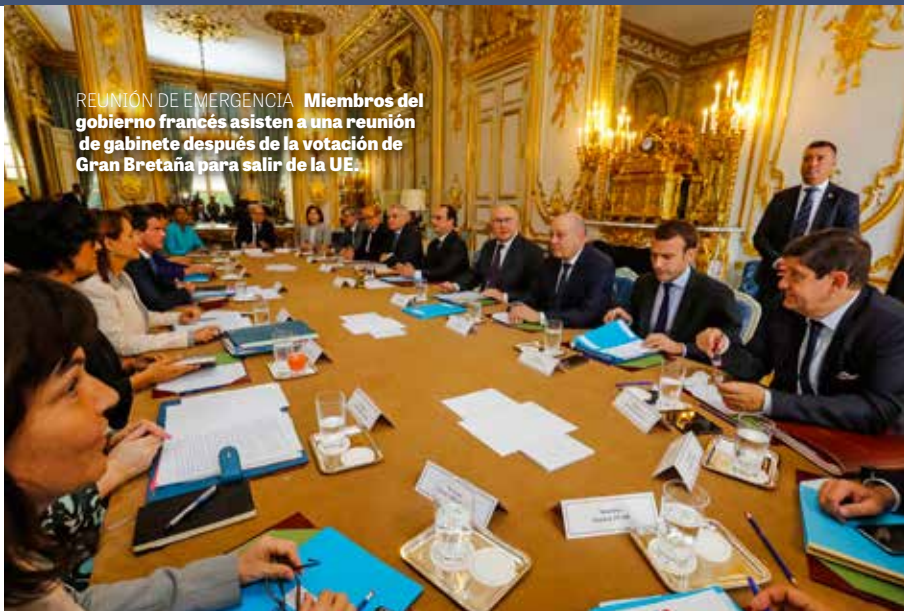
REUNIÓN DE EMERGENCIA. Miembros del gobierno francés asisten a una reunión de gabinete después de la votación de Gran Bretaña para salir de la UE.