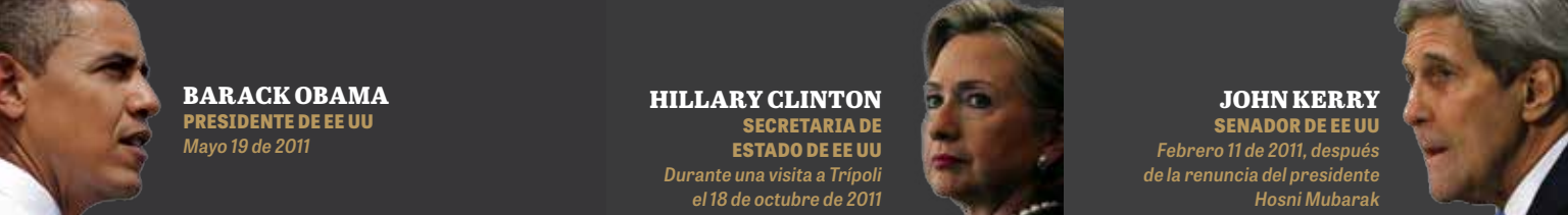
BARACK OBAMA PRESIDENTE DE EE UU Mayo 19 de 2011