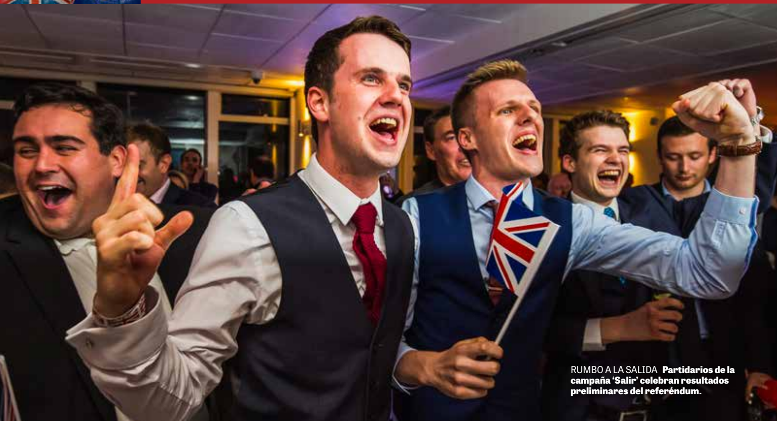
RUMBO A LA SALIDA Partidarios de la campaña 'Salir' celebran resultados preliminares del referéndum.