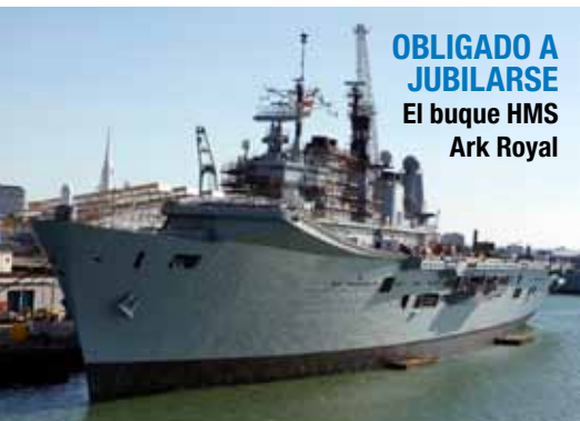
OBLIGADO A JUBILARSE El buque HMS Ark Royal

entre Gran Bretaña y Francia (forjado en 1904, llamado Entente Cordiale ) en respuesta al potencial del surgimiento de Alemania como un poder. Hoy día, una vez más, Alemania es claramente la nación fuerte de Europa, y se podría ver esta alianza como un intento de Francia para establecer su liderazgo militar y hacerle contrapeso a la influencia de Alemania. Éste es el punto de vista de los analistas en Stratfor. Y aparentemente, a pesar de la desconfianza generalizada de la población del Reino Unido contra la Unión Europea,