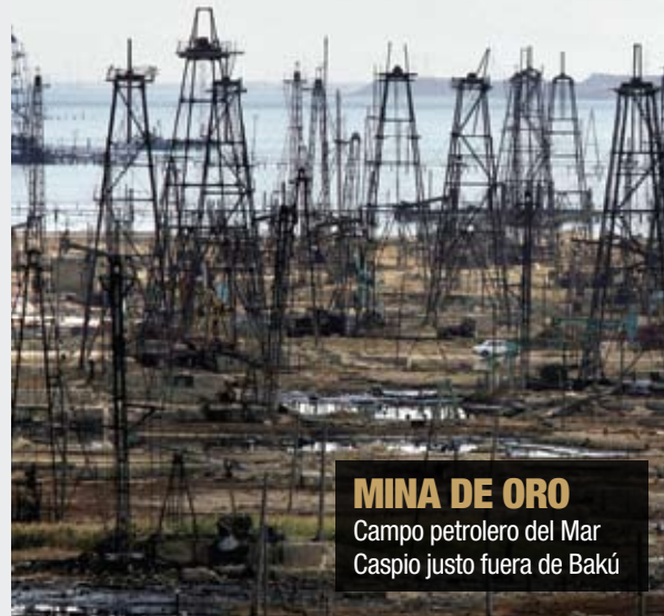
MINA DE ORO Campo petrolero del Mar Caspio justo fuera de Bakú

Enfadada con esta situación, Europa está comparándolo de otros lados. Aunque Irán y otras naciones del Oriente Medio le han ofrecido satisfacer sus necesidades, estas fuentes pudieran ser tan volubles como Rusia, si acaso aún más. La única esperanza de Europa para obtener su gas, aparte del impredecible y volátil Oriente Medio, proviene del Cáucaso, el Mar Caspio y el Asia central. Por