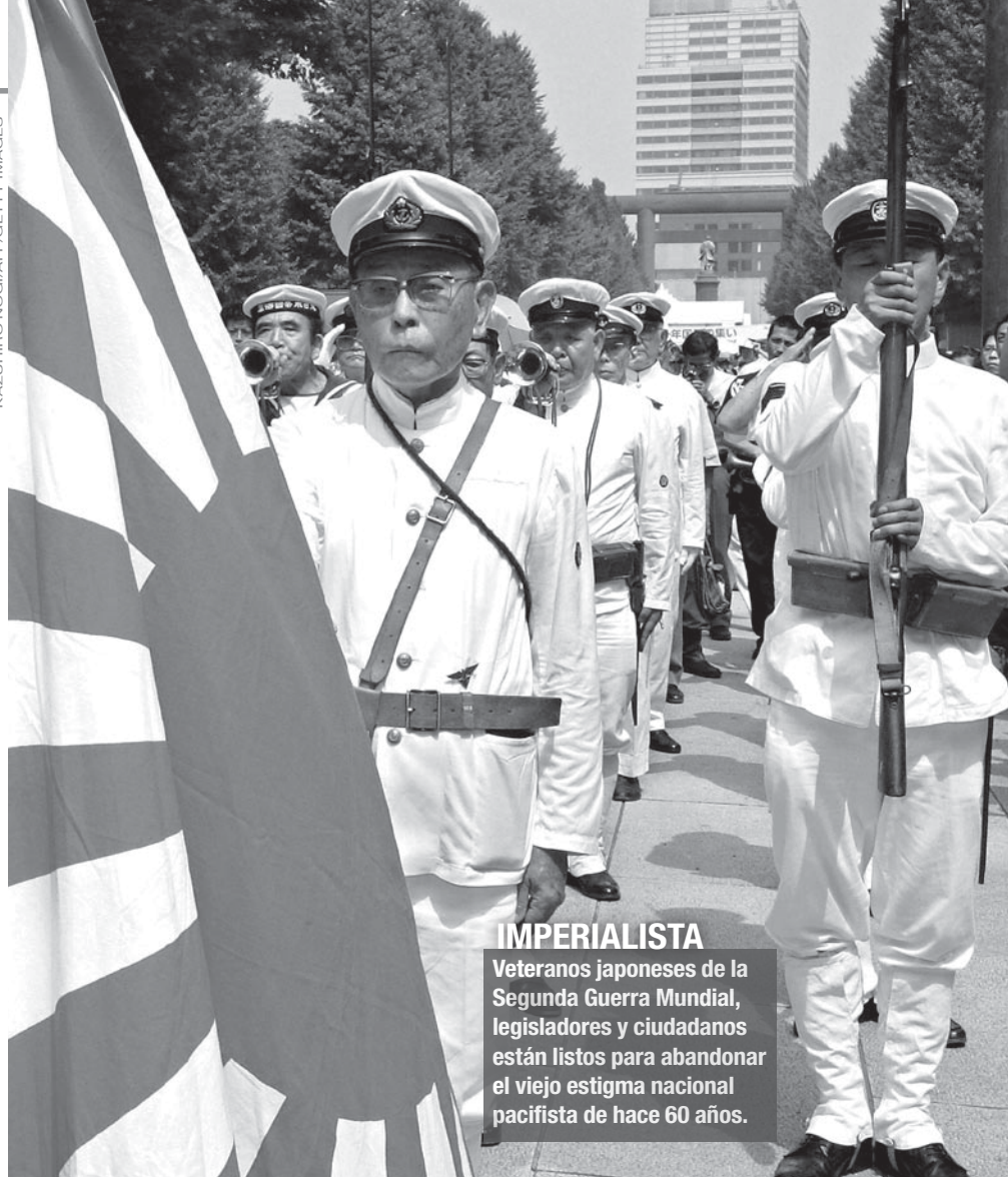
IMPERIALISTA Veteranos japoneses de la Segunda Guerra Mundial, legisladores y ciudadanos están listos para abandonar el viejo estigma nacional pacifista de hace 60 años.

Clemons respondió al enigma presentado por él mismo: “El nacionalismo japonés ha hervido por décadas debajo de un velo pacifista superficial, parece ir