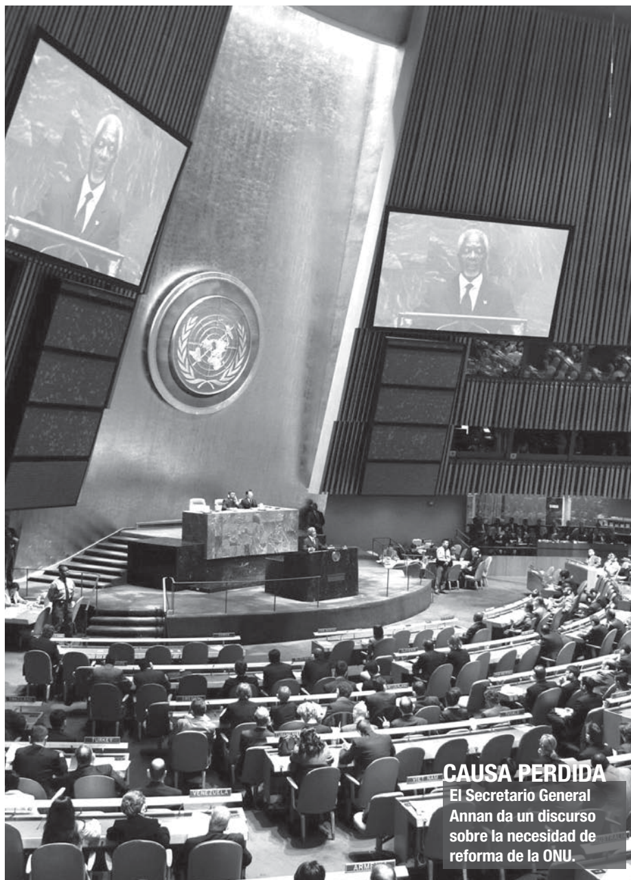
CAUSA PERDIDA El Secretario General Annan da un discurso sobre la necesidad de reforma de la ONU.

El Secretario General Annan encabezó la lista de aquellos sujetos a la crítica.