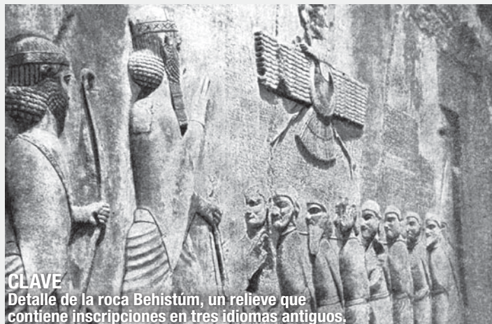
CLAVE Detalle de la roca Behistún, un relieve que contiene inscripciones en tres idiomas antiguos.

Sin embargo, no fue sino hasta fines del siglo 19 que se comenzó un estudio y una evaluación sistemática del Oriente Cercano. Esta región geográfica es conocida como el Creciente Fértil. El egiptólogo James Henry Breasted usó