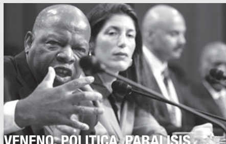
VENENO, POLITICA, PARALISIS El congresista demócrata John Lewis habla contra el nombramiento de John Roberts para ser Juez de la Corte Suprema.

Charles Krauthammer resumió la política de elecciones en EE UU de esta manera: “Cada dos años la industria