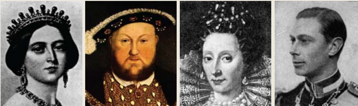
HISTORIA REAL los monarcas de Gran Bretaña (de izquierda a derecha) reina Victoria, rey Enrique VIII, reina Isabel I, rey Jorge VI

hombre blanco, a todo” (El Ultimo León). Durante el siglo 19 bajo la reina Victoria, como lo escribió Churchill en Una Historia de los pueblos de habla inglesa , “el Soberano se ha convertido en el símbolo del Imperio”. Bajo Victoria, la corona real se volvió el elemento unificador del vasto y diverso Imperio Británico.