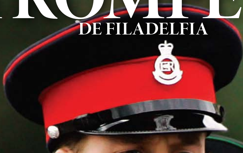
Príncipe William de Gales