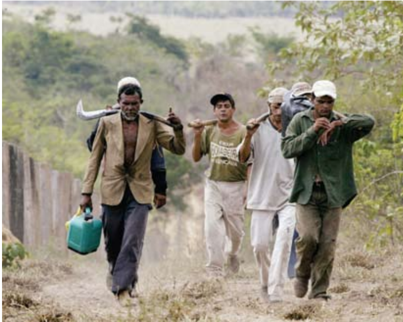
EXPLOTADOS Esclavos en Brasil regresan de arduo día de trabajo en el Amazonas.