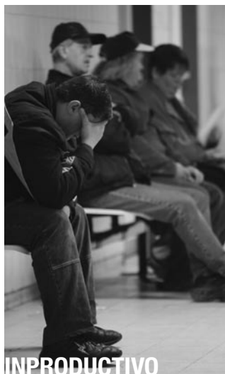
INPRODUCTIVO Los desempleados esperan afuera de una oficina de empleos en Berlín.

Usted necesita enfrentar esta realidad emergente, la cual está destinada a sacudir a las naciones (Isaías 14:16). Escriba ahora pidiendo nuestro folleto Daniel—Unsealed at Last! (actualmente solo en inglés) y comprenda la realidad de lo que está sucediendo en estos momentos en el corazón de Alemania dirigido hacia la descarga más explosiva de fuerza política y militar que este mundo haya visto jamás! Esta explosión de energía acumulada finalmente terminará como la guerra que puso fin a todas las guerras, e introducirá, no un Reich Teutónico milenial y esclavizante, sino una era de libertad genuina, paz y abundancia, bajo el Rey de reyes, Jesucristo, como el mundo nunca ha visto, pero siempre ha añorado. ■