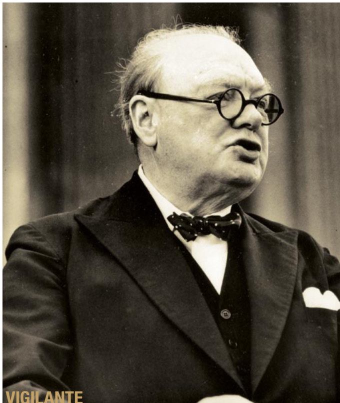
Winston Churchill ya no está, pero sus palabras de advertencia deberían ser más vivas que nunca, para nosotros.

¡Churchill fue un instrumento para evitar que la civilización occidental muriera! ¿Por qué continuamos ignorando o escondiéndonos de su mensaje de advertencia? Su advertencia debe-