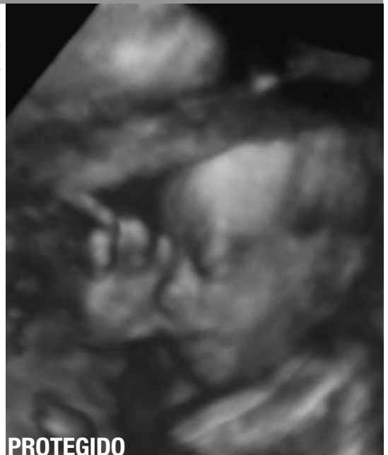
PROTEGIDO Una imagen de ultrasonido en tercera dimensión muestra a un niño nonato chupándose el pulgar mientras es nutrido dentro del útero.

■ Nacimiento. ¡El nacimiento físico de un niño que es traído al mundo es verdaderamente espectacular! Cuando el cordón umbilical es cortado y el niño toma su primer respiro, ya no es más dependiente de su madre para obtener oxígeno. él se vuelve una vida humana independiente y autónoma en lugar de una vida humana dependiente . ¡De igual modo, el nacimiento espiritual de un cristiano en el Reino de Dios será espectacular más allá de lo imaginable! Cuando los hijos engendrados de Dios sean entregados por la Iglesia al Reino, o Familia, de Dios, literalmente nacerán de nuevo, ésta vez del Espíritu de Dios que está dentro de ellos (o el que tenían cuando murieron). ¡Ellos entonces estarán totalmente compuestos de espíritu