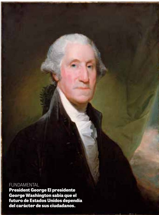
FUNDAMENTAL President George El presidente George Washington sabía que el futuro de Estados Unidos dependía del carácter de sus ciudadanos.

El presidente Washington creía, en esencia, que el CARÁCTER LO ES TODO. Él dijo: “Ahora tenemos un carácter nacional que establecer”. En las campañas políticas de hoy, el carácter no se menciona en absoluto. La mayoría de los estadounidenses parecen pensar que no tiene relación con la aptitud de un hombre para gobernar. La moral personal y el deber público se consideran cuestiones separadas. ¡Washington habría estado consternado por ese tipo de pensamiento!