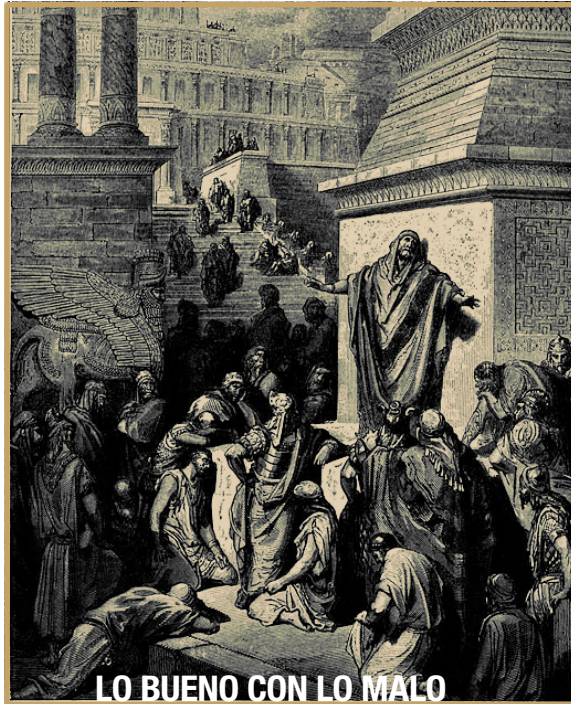
Jonás proclamó un mensaje de advertencia lleno de noticias malas, pero la ciudad que escuchó su mensaje experimentó unas noticias muy buenas.

Dios, y se arrepintieron de verdad. La ciudad fue salvada del destino horrible sobre el que habían sido advertidos. Esta fue, y permanece hasta este día como la única vez en la historia que una ciudad gentil se ha arrepentido ante Dios. Qué ejemplo de esperanza nos dejaron ellos para nuestro tiempo actual. Qué hermosos resultados produjo la advertencia de Dios en Nínive. Por favor escriba solicitando un ejemplar gratis de nuestro folleto sobre Jonás, si no tiene uno.