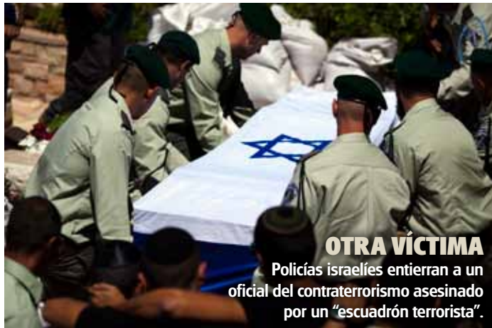
OTRA VÍCTIMA Policías israelíes entierran a un oficial del contraterrorismo asesinado por un “escuadrón terrorista”.

cruce de balas. Esto fue como echarle gasolina a un incendio en cuanto a la animosidad de Egipto contra Israel; “lo que fue tolerado en Egipto antes de la revolución no va a ser tolerado en el Egipto pos revolucionario”, escribió el primer ministro de Egipto, Essam Sharaf.