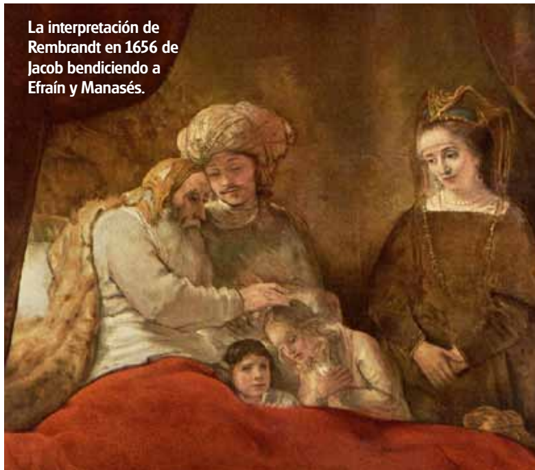
La interpretación de Rembrandt en 1656 de Jacob bendiciendo a Efraín y Manasés.

En su libro, Antiquitates Apostolicae , William Cave explica más acerca de este tema del ministerio de Pedro. Pedro no predicó el evangelio en Roma. El apóstol