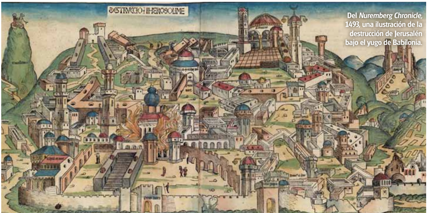
Del Nuremberg Chronicle, 1493, una ilustración de la destrucción de Jerusalén bajo el yugo de Babilonia.

No obstante, Israel nunca regresó. Lea la historia de la Iglesia de Dios en el libro