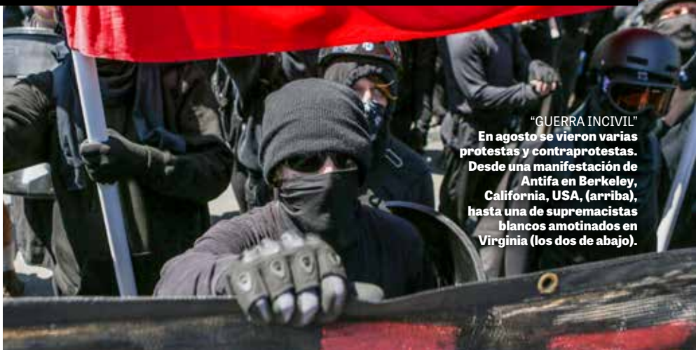
"GUERRA INCIVIL" En agosto se vieron varias protestas y contraprotestas. Desde una manifestación de Antifa en Berkeley, California, USA, (arriba), hasta una de supremacistas blancos amotinados en Virginia (los dos de abajo).