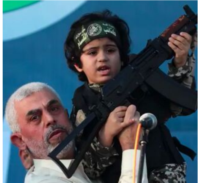
El líder de facto de Gaza, Yahya Sinwar, levanta a un niño con una pistola en la mano y vestido con un uniforme de Hamás tras la última ronda de combates contra Israel. (Captura de pantalla)

¿Sabía usted que el conflicto israelí-palestino, incluyendo el amargo "proceso de paz", fue profetizado en la Biblia? La Biblia no sólo profetizó sobre ese conflicto, sino que revela la única solución, y cuál será el resultado final. Para saber más, solicite su ejemplar gratuito del folleto " Jerusalén en profecía " de Gerald Flurry. ■