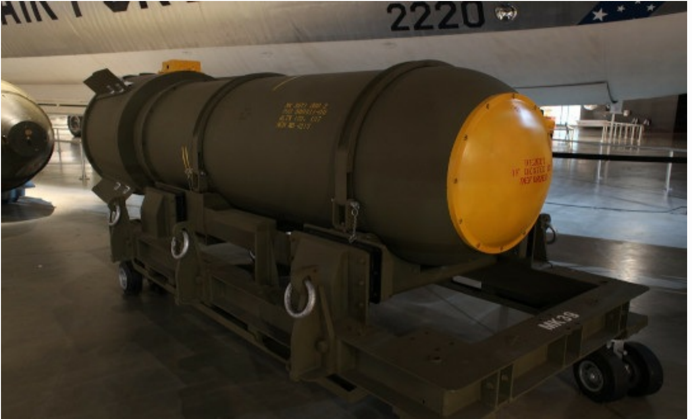
BOMBA NUCLEAR MARK 39